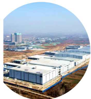
山东枣庄 鲁南新能源产业园项目

园内,打造绿色安全“锂电之都”;智慧厂房,赋能科技创新先进制造……开年来,中国建筑在重大科技创新项目建设上加紧发力,助力传统产业转型升级。