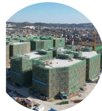
福建泉州 海峡雕艺文化园项目北区

万吨锂电箔厂房1栋、年产10万吨铜材厂房1栋、倒班楼、办公楼以及配套用机加工车间,研发中心、储能电站、仓库等。作为湖北省重点工程,项目建成后将进一步激活黄石铜资源优势,加快黄石市铜产业向千亿产业集群迈进,助推湖北新能源产业发展迈上新台阶,为全省产业转型升级、经济高质量发展作出积极贡献。