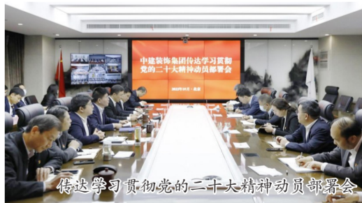
传达学习贯彻党的二十大精神动员部署会

党的二十大对推进社会主义现代化国家建设作出的系统部署,对国有企业做强做优做大提供